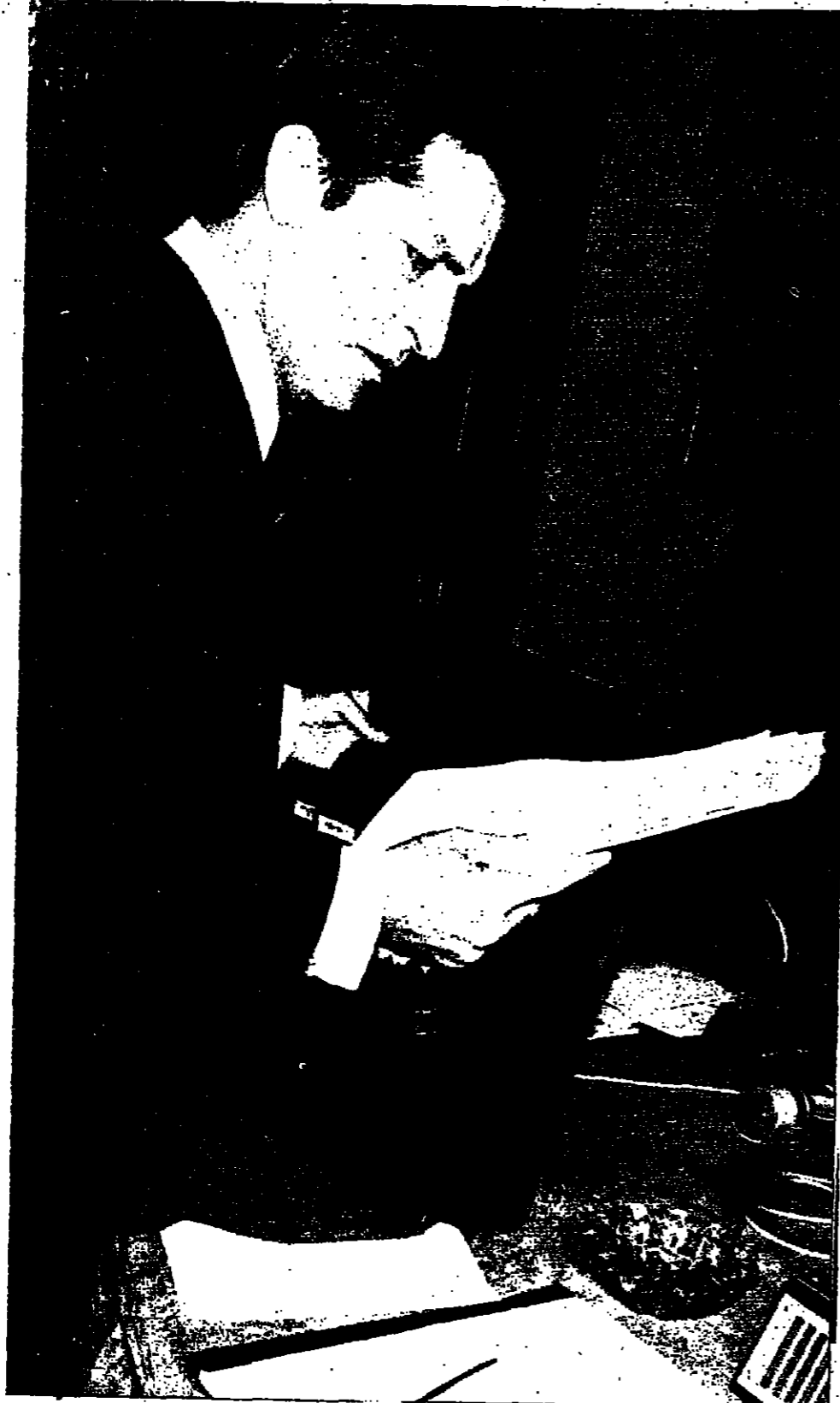
ادولفو سواريزي: هل يصحح سياسة مدريد شبه المحايدة؟

في ١٩٧٣ تم توقيع اتفاقية في باريس بين دول السوق الأوروبية المشتركة والولايات المتحدة الأمريكية التي تنص على انضمام الولايات المتحدة الى السوق الأوروبية المشتركة في ١٩٧٣.